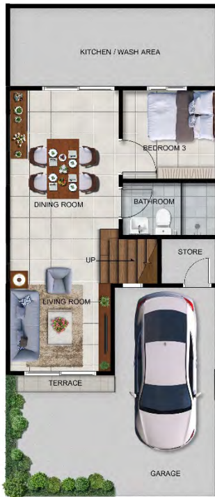
Thamm 3 Floor