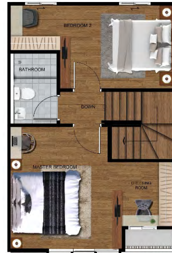
Thamm 3 Floor 2